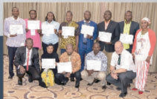
REMISE DES ATTESTIONS - MOOV