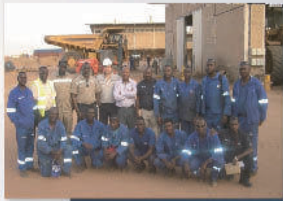
AGENTS SOLUTIONSRH & ESM ARLIT AOÛT 2010