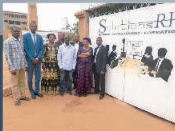
EQUIPE 2019 CABINET SOLUTIONSRH